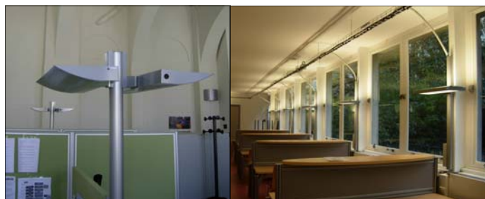
Alimentation faux-plancher double vasque

Commande à hauteur du plan de travail (pour les P.M.R) sur mât ou par boîtier déporté