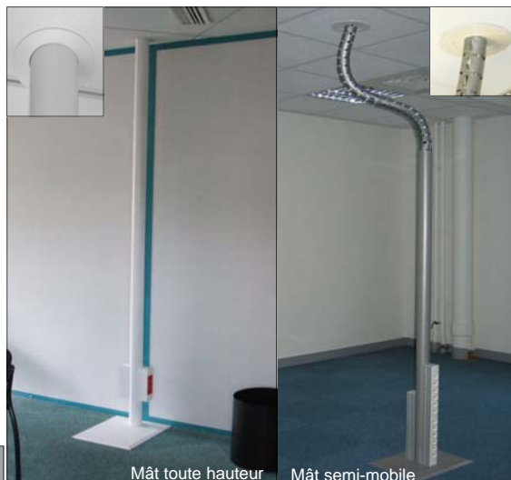
Mât toute hauteur

Découpe du(es) capot(s) pour fixation des boîtiers-prises en pied de mât