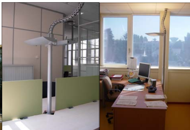
Semi-mobile double vasque